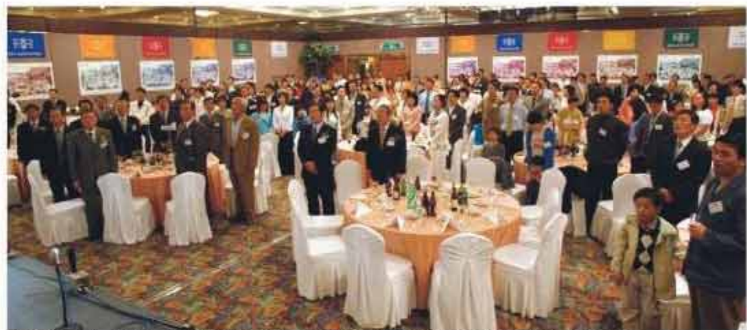
제39회 동문·가족들이 20년 만에 맞는 홈커밍축제 기념식에서 교가를 제창하고 있다.

'아름다운 만남·신선한 감동'의 홈커밍데이축제가 활짝 피고 있다. 제39회동기회는 졸업 20년 만에, 제29회는 두 번째로 행사를 치렀다. 또 제19회동기회는 오는 5월 21일 졸업40주년, 제9회는 50주년 행사(일정 추후 발표)를 각각 준비하고 있다.