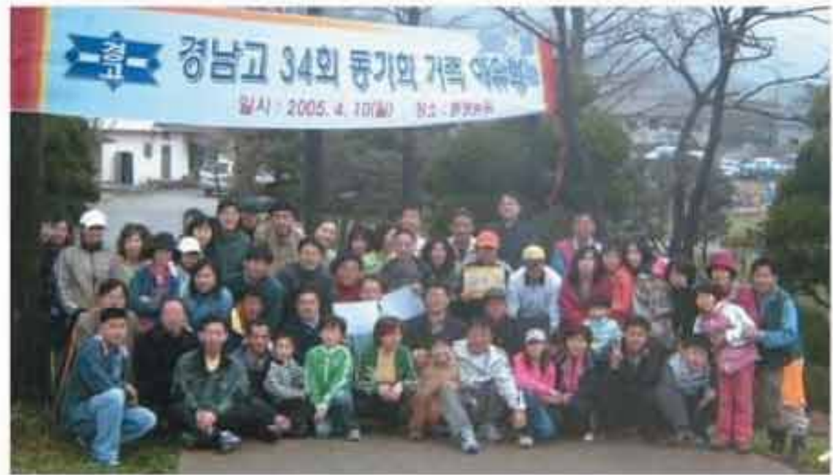
제34회동문·가족들이 경남양산 근교 동명농원에서 야유회를 즐기며 기념촬영을 하고 있다.