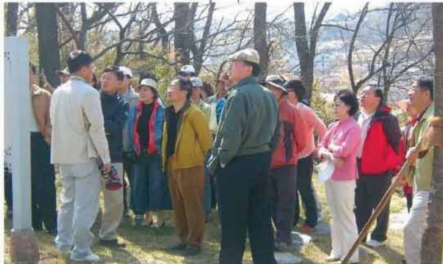
제27회 동거회 국토문화탐사대 대원들이 해미읍성 안에서 '역사'의 숨결'을 아로새기고 있다.