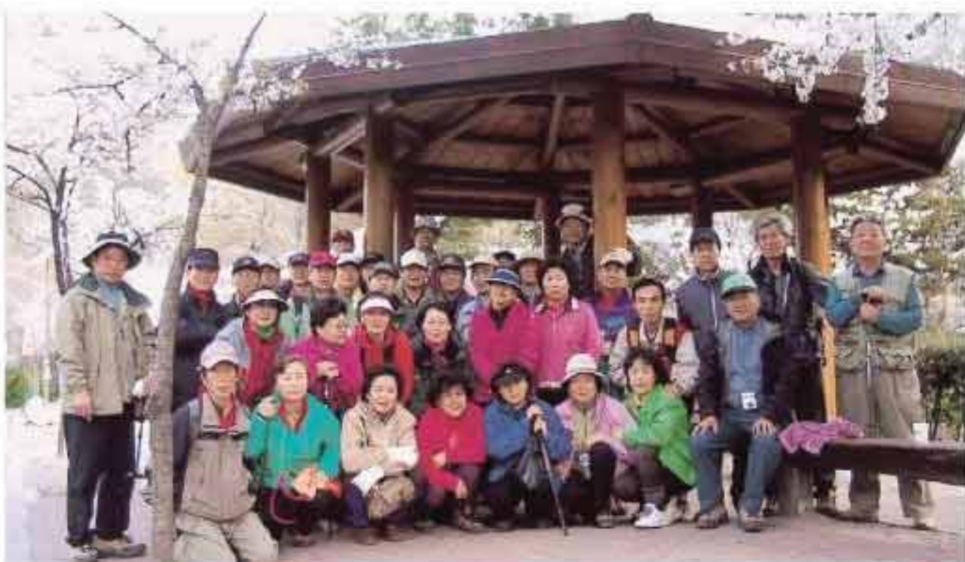
제16회동기회 동문·가족들이 전남화순 운주사-광주 무등산-전남 담양-경남 함양 등지로 수학여행을 하다가 포즈를 취하고 있다.

보리밥의 명가 무향촌에서 아침밥을 먹은(09:30) 일행은 전남 담양으로 이동해 담양호~금정산성~죽재박물관을 탐방하고 전북 순창을 거쳐(순두부가든에서 중식) 경남 함양에 닿아 벽송사와 서암 등에서 불교 문화의 숨결을 아로새겼다.