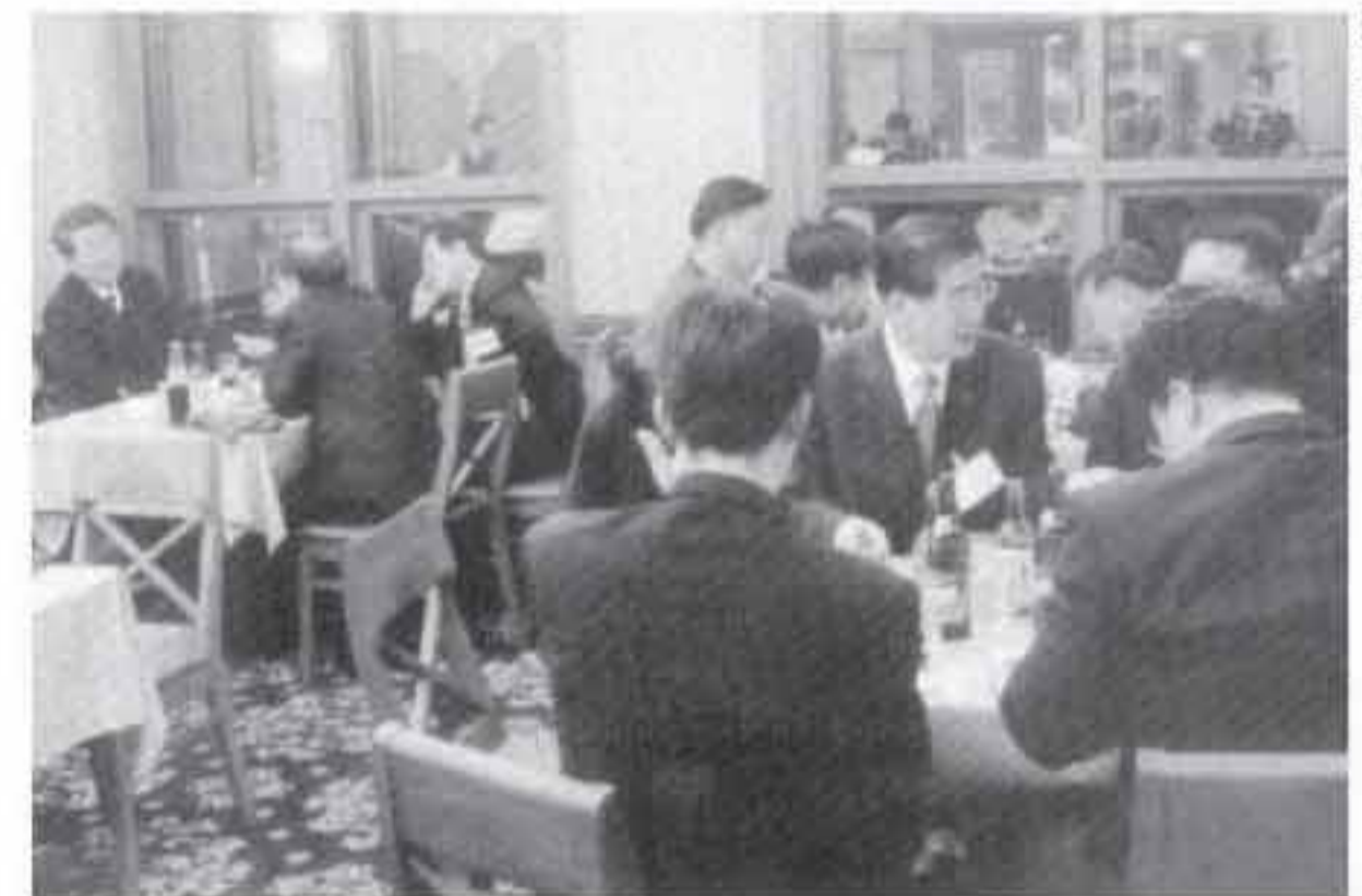
3월22일 열린 등대회 정기월례회 모습. 이날 회의에서는 회원수첩 제작 등 주요의제를 의결했다.

업 대표이사)이 주재한 이날 행사는 풍선터뜨리기 · 자녀대항 릴레이 · 부부삼각달리기 · 어린이기마전 · 자녀동요대회 · 족구 등 가족 위안 잔치로 배풀어졌다.