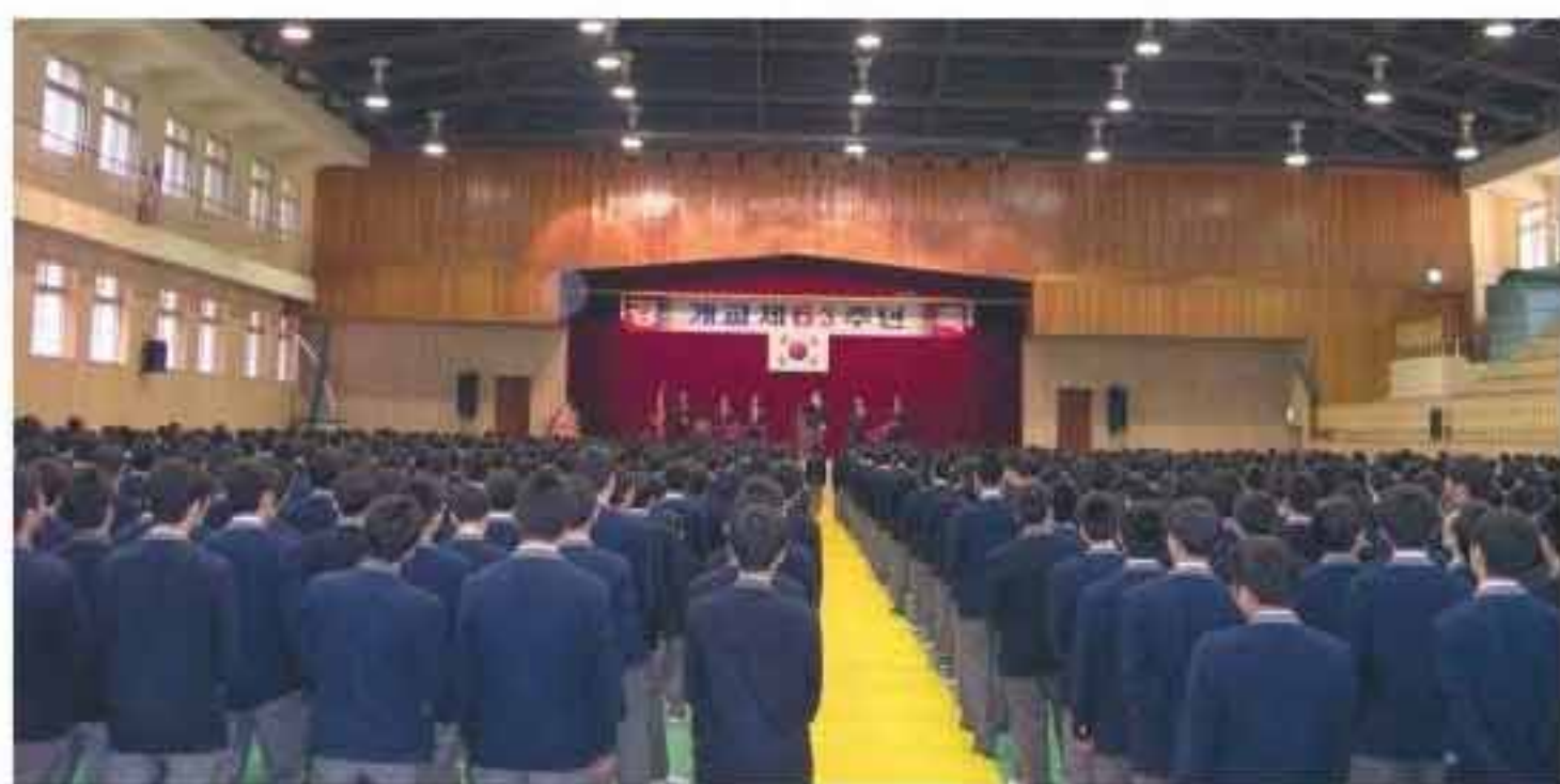
학교 체육관에서 거행된 경남고 개교 제63주년 기념식.

이어 부대행사로 애교심 함양을 위해 '학교를 상징하는 캐릭터 그리기' 대회를 열었다.