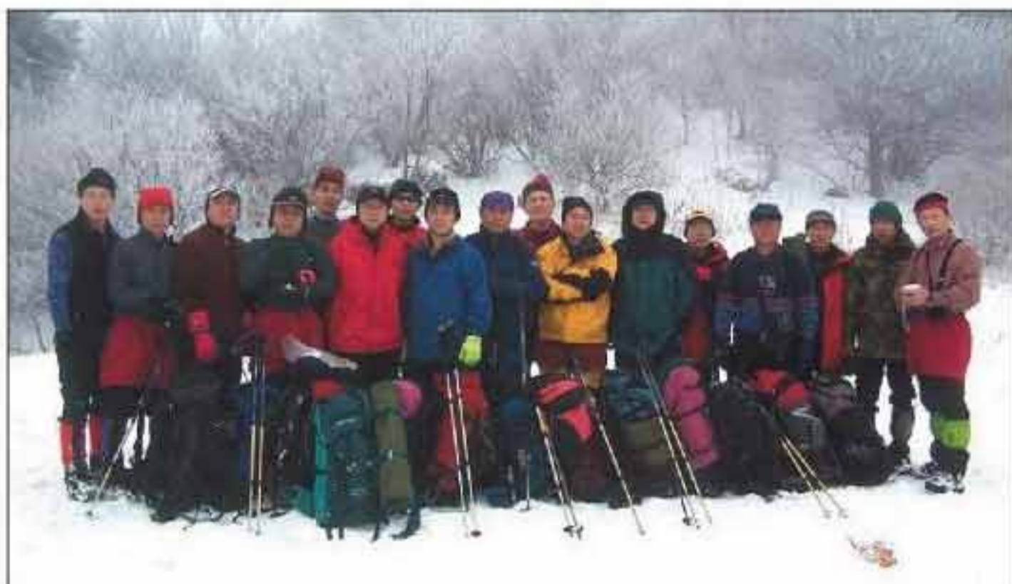
제10차 지리탐구에 나선 구덕산우회 동문들이 러셀산행을 성공시킨 후 포즈를 취하고 있다.