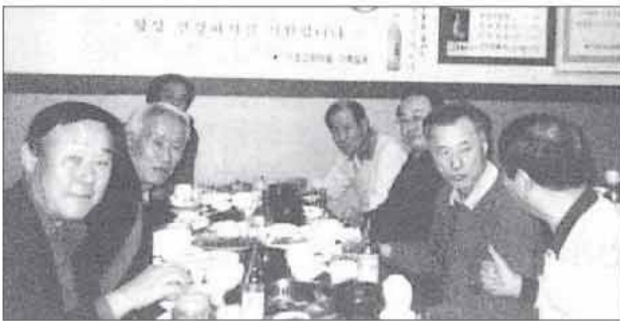
재경 14-K 당구회 회원들이 창립 1주년 기념 친선당구대회를 연 후 자축연에서 우정을 나누고 있다.

은 아리아케산 등반길에 올라 정상에 밟았다. 하산 후 시내 관광을 하고 오후 2시 30분 선편으로 부산에 도착했다.