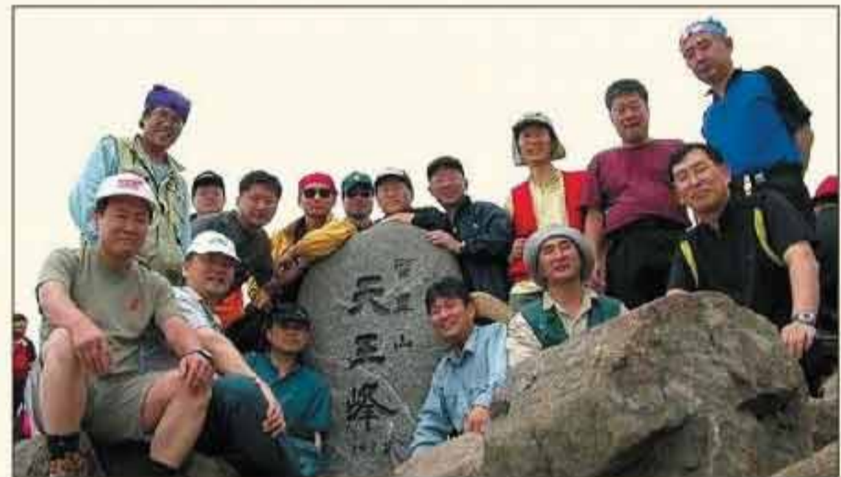
천왕봉에 오른 이팔산우회 산꾼들이 창립 6주년 기념 지리산 등반대회의 성공을 기리며 기념 촬영.

'좀 더 일찍, 좀 더 빨리'라는 캐치프레이즈를 내건 이팔산우회 창립 6주년 기념 등반대회가 지난 6월 14~15일 지리산에서 펼쳐졌다.