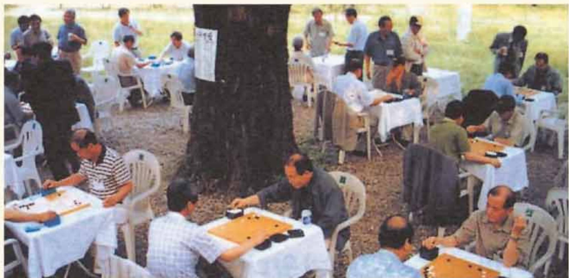
서울 우이동 그린파크호텔 은행나무 그늘 밑에서 열린 제18회 2003 경부친선 바둑대회. 올해는 부산팀이 이겨 작년 패배를 설욕했다.

제27회동기회 마라톤회 6월 스퍼트가 같은 달 14일 오후 6시30분 부산 해운대해수욕장 옆 동백섬에서 열렸다. 이날 달리기에는 언제나 '27기발'을 앞세우고 맨 먼저 나와 기다리는 박상훈 회장을 비롯해 먼 곳인데도 먼저 와서 달리고 있는 장기남, 얼마전 포항마라톤대회에서 완주한 '마라톤 3단' 경지의 이형복 부부(부인 한경애), 지칠 줄 모르는 백민호, 여간해서 빠지지 않는 조봉관 부부(부인 김정희), 신도시에서 현장까지 달려온 태기섭 부부(부인 김정희) 등 9명이 참가했다.