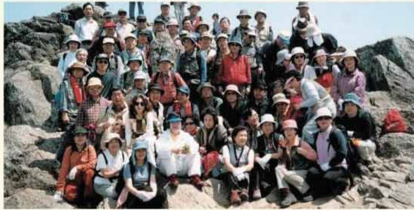
제19회 서울·부산 용마가족들이 덕유산에서 펼쳐진 경부합동산행대회 후 기념촬영을 하고 있다.