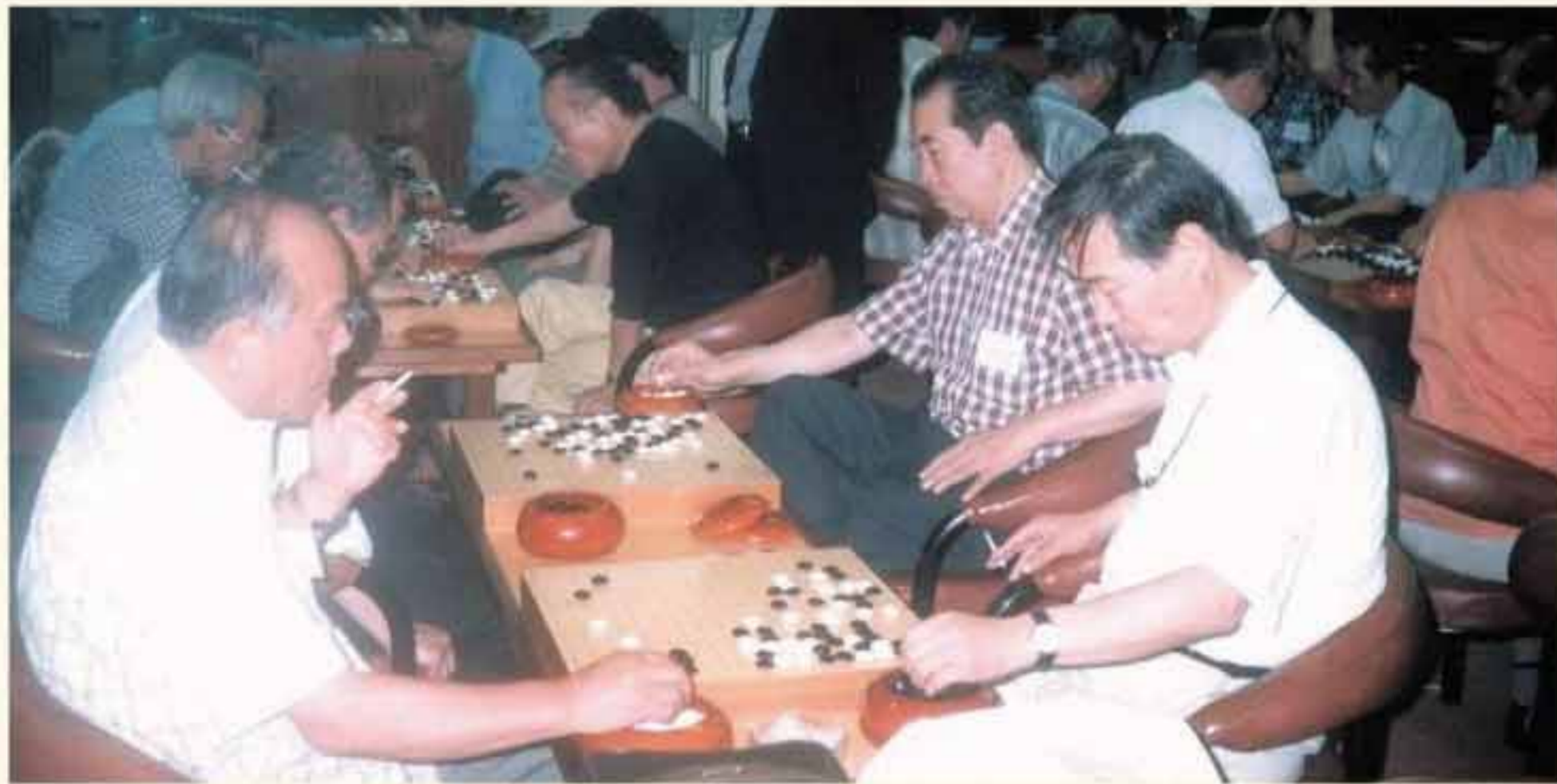
치열한 변상격전. 지난 7월20일 열린 제3회 기별대항 용마바둑대회에서 출전한 대표 선수들이 동기회의 명예를 위해 선전하고 있다. 이날 제 13A·18·29회가 각각 중·장·청년부에서 우승했다.

발행·편집인: 박 동 열 발행처: 경남중고동창회동창회 부산광역시 중구 부평동 4가 52-3 골든 O/T 411호 Tel: (051)245-7551 ~ 3, FAX: 245-7550 홈페이지: www.kyungnam.or.kr 인쇄처: (주)중앙인쇄 (051)636-9477 재경동창회=서울 영등포구 여의도동 45-20 동복빌딩 504호 Tel: (02)783-0071 ~ 2, FAX: (02)783-0073