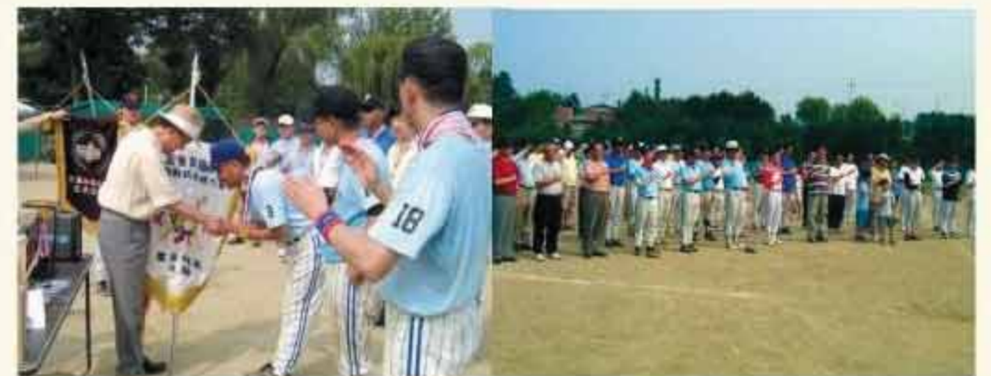
재경동창회 주최 제35회 기별대항야구대회 시상식(왼쪽)에서 제39회팀이 우승기를 받고 있다. 오른쪽은 대회식에 참석한 동문들.