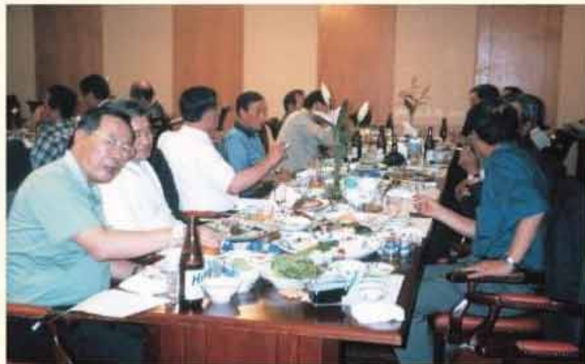
부산에서 우정의 그린 샷을 날린 제12회 동기회 서울·부산 골퍼들이 친선대회 후 단합회를 열고 있다.

이날 회의는 △격월제(작수달)마다 모임 개최 △동문 총괄명부 작성 △초청 인사 명단 작성 △중학교 졸업 동문 적극 참여 홍보 △행사 슬로건 공모 등 의안을 가결했다.