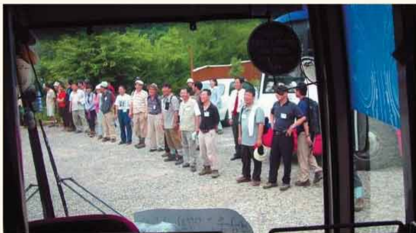
산행을 마친 후 서울 동문들이 천태산 들머리에 한 줄로 서서 부산으로 떠나는 동문들을 환송하고 있다.

시원한 막걸리 등으로 갈증을 풀 일행은 산우회장의 다달에 못 견디 부산행 버스에 올랐고, 일찍 서든 바람에 오후 6시쯤 부산 거제동 법조타운에 도착, 부근 놀부부대찌개 집에서 해단식을 치렀다.