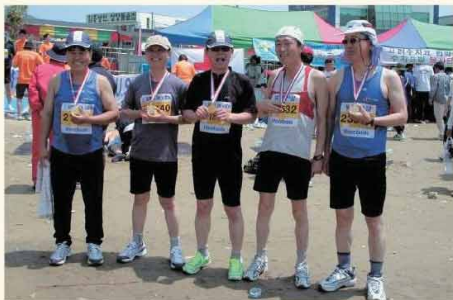
제31회동기회 마라톤회 마니아들이 다대포마라톤대회 10km코스에 출전, 완주기록을 세운 후 '완주 금메달'을 목에 걸고 포즈를 취하고 있다.

자랑스런 완주 금메달을 전원 목에 걸고 기념촬영을 한다(사진). 응원단과도 추억을 남기기 위해 '찰칵!'한다.