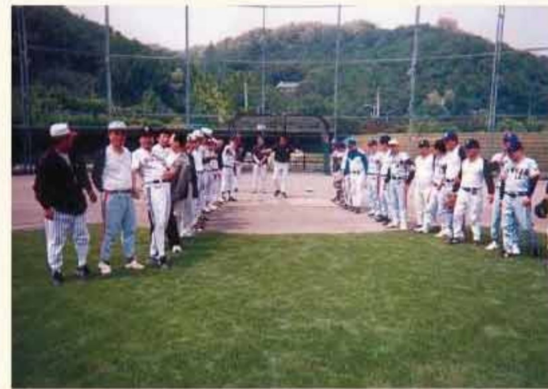
제24회 경부친선 야구대회가 27년 전통으로 동창회 시상 '동기회교류전' 최고(最古)를 자랑하고 있다. 서울에서 열린 올해 대회에서 서울·부산 선수들이 상견례를 하고 있다.