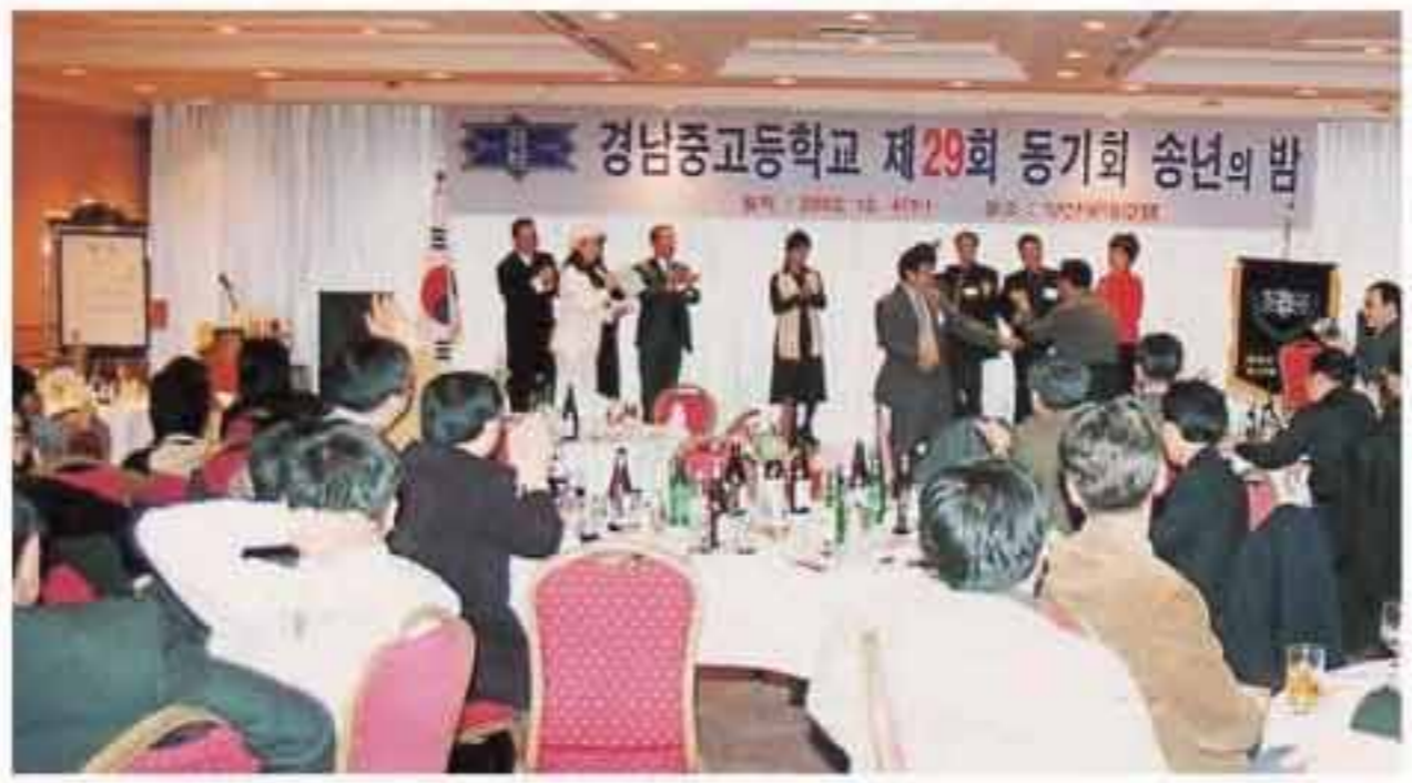
제29회동기회 송년잔치에서 동문·가족들이 한데 어울려 즐거운 시간을 보내고 있다.

본부동창회 특별상을 받았다. 박동열 본부회장을 비롯, 김재근 마창회장 고용석(22회)·김창수(22회)·김성주 동문(27회) 등이 행운상품을, 경인회(회장 윤경준·21회) 등 많은 동문들이 특찬금을 쾌척했다. 김영삼 전 대통령(3회·본부 고문)·이근식 행자부 장관(19회)·김정부 국회의원 등이 축전을, 재경동창회(회장 이상택·13회)를 비롯 거제(회장 서수홍·16회)·진주(회장 정순일)·양산(회장 이수천)·포항(회장 박상식)·대전동창회(회장 김덕수·이상 19회)에서 축하화환을 보내왔다.