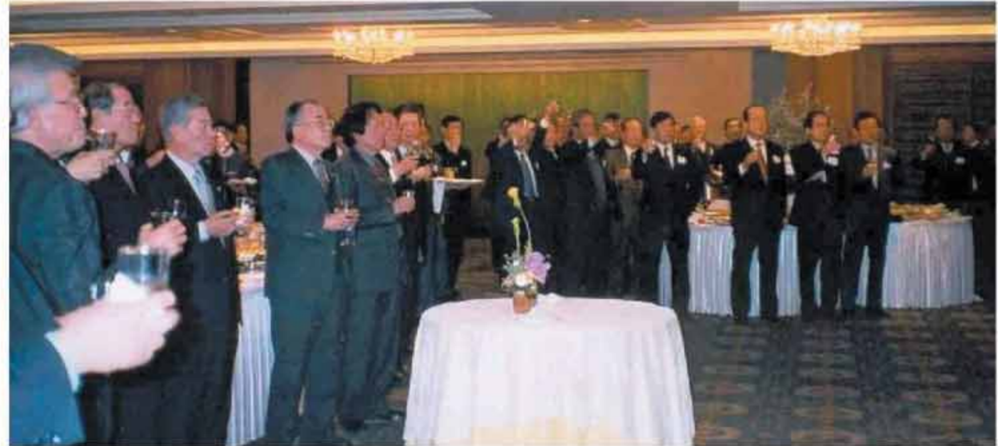
지난 1월8일 서울 소공동 롯데호텔 사파이어볼룸에서 열린 재경동창회 2003년 신년회.

모교 지원 사업은 학업증진과 교육환경 개선 부문 등에 성의껏 대처할 방침이다.